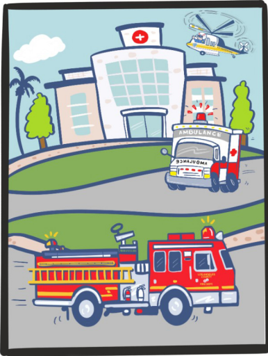
آمبولانس به بیمارستان