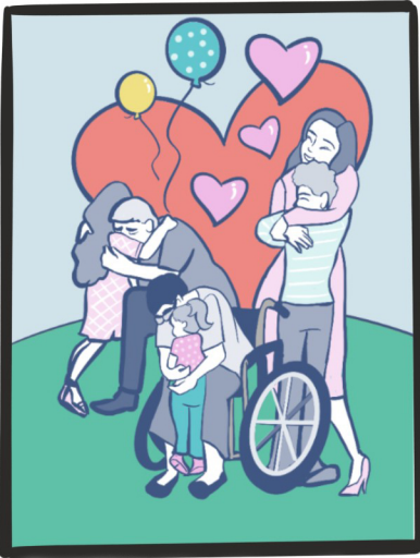
پیوستن مجدد به خانواده