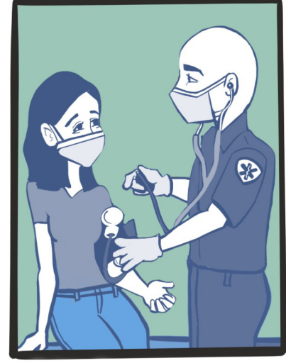
پزشک به شما کمک می‌کند